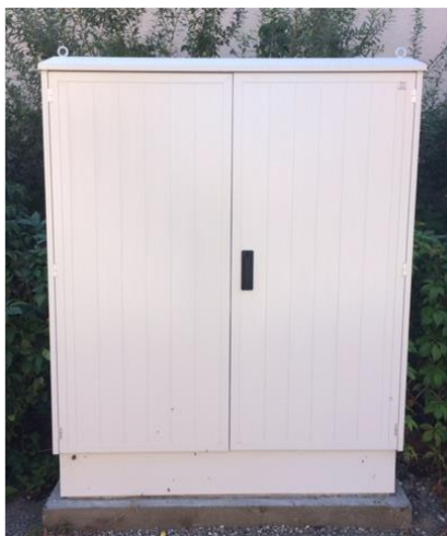
Slika 2. Prikaz ormara tipa Cabinet AP-DD, 2P Tel

Za lokaciju Suhopolje u Kijevu koristit će se ormar tipa Cabinet AP-DD 2P tel 150x180x40 cm. Ormar je samostojeći, dvoja vrata, sa metalnom šablonom za ugradnju. Dimenzije ormara su 150x180x40 cm i izrađen je od Al lima, antikorozivno zaštićen plastificiranjem, opremljen krovom za zaštitu od kiše te sustavom za zaključavanje.